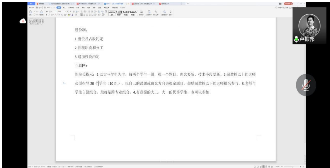
图 1 科研工作线上会议

【艺术设计学院 讯】为进一步提升我院教师的科研能力，完成学院建设硕士点指标，根据江西服装学院科研会议精神并结合我院实际情况，于2022年4月20日在线上召开了科研工作推进会，本次会议由副院长卢振邦主持，刘琳院长、党组织冯琼芳书记、黄超群副书记、学院骨干教师等参加本次会议。