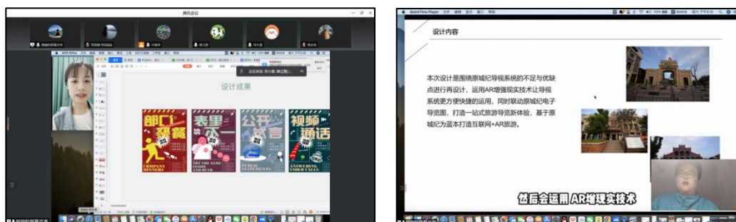
图3 学生讲解过程截图

答辩老师以认真、严谨的态度，考察了毕业生掌握专业知识的熟练程度，对同学们的毕业设计进行了认真的审核，肯定了设计中的闪光点，同时也指出需要改进的地方。毕业设计审核答辩既是考察同学们对自己设计作品制作流程的熟悉程度，同时也是对同学们专业知识的掌握程度及心得体会的考察。同学们的设计作品整体主题鲜明，创新意识较强，一定程度上符合市场需求。