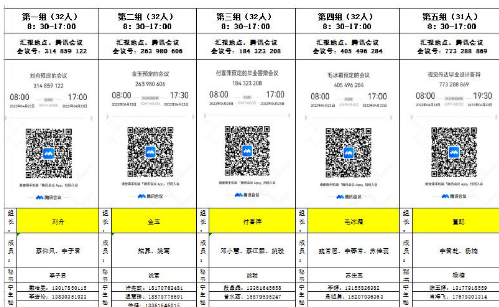
图 1 审核答辩安排表

【撰稿：蔡仰风】毕业设计工作是对毕业生专业知识掌握的深度和广度的检验，全面考查学生综合运用所学理论、知识和技能解决实际问题的能力。艺术设计学院视觉传达设计专业 2022 届毕业生审核答辩于 2022 年 4 月 23 日 8:30-17:00 在腾讯会议如期举行，此次答辩涉及 159 个毕业生，分五组进行。负责此次审核答辩教师为视传专业的全体教师。此次答辩过程由答辩秘书曾水茗同学、段晶晶等 11 位同学负责相关记录。